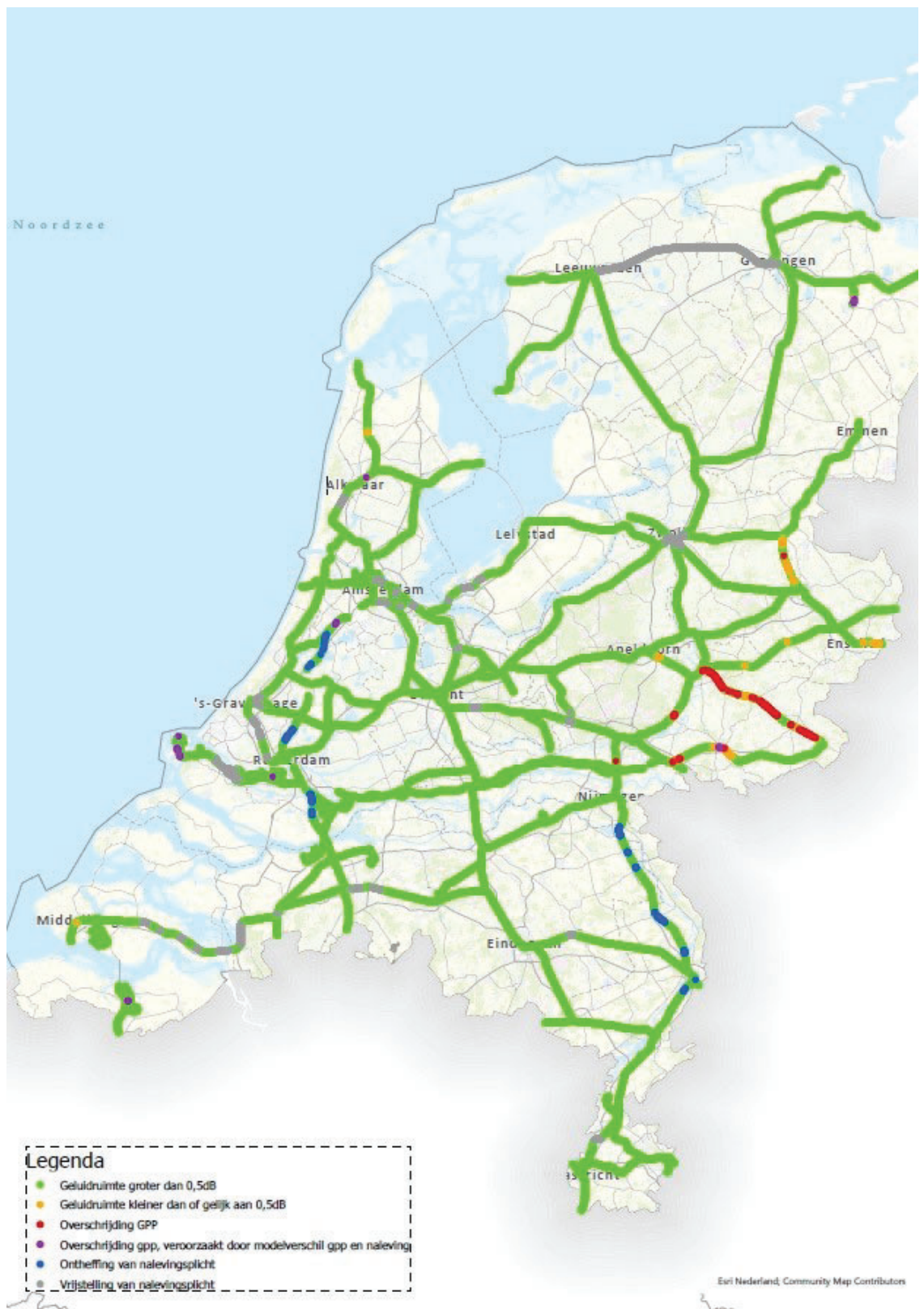
Figuur 2: Landelijk beeld van de gpp-naleving in 2021