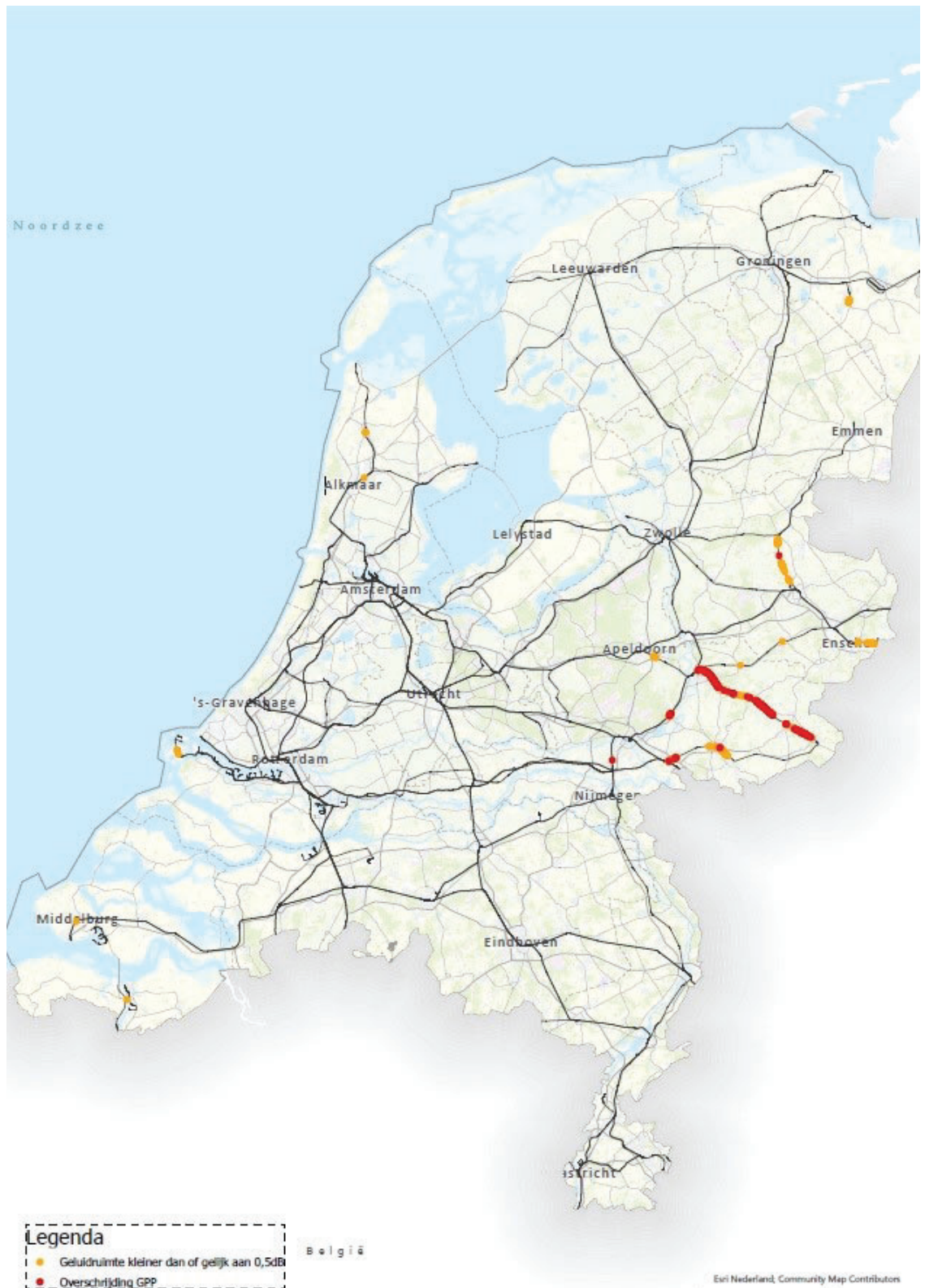
Figuur 1: Landelijk beeld van gpp-overschrijdingen en baanvakken met een krappe geluidruimte